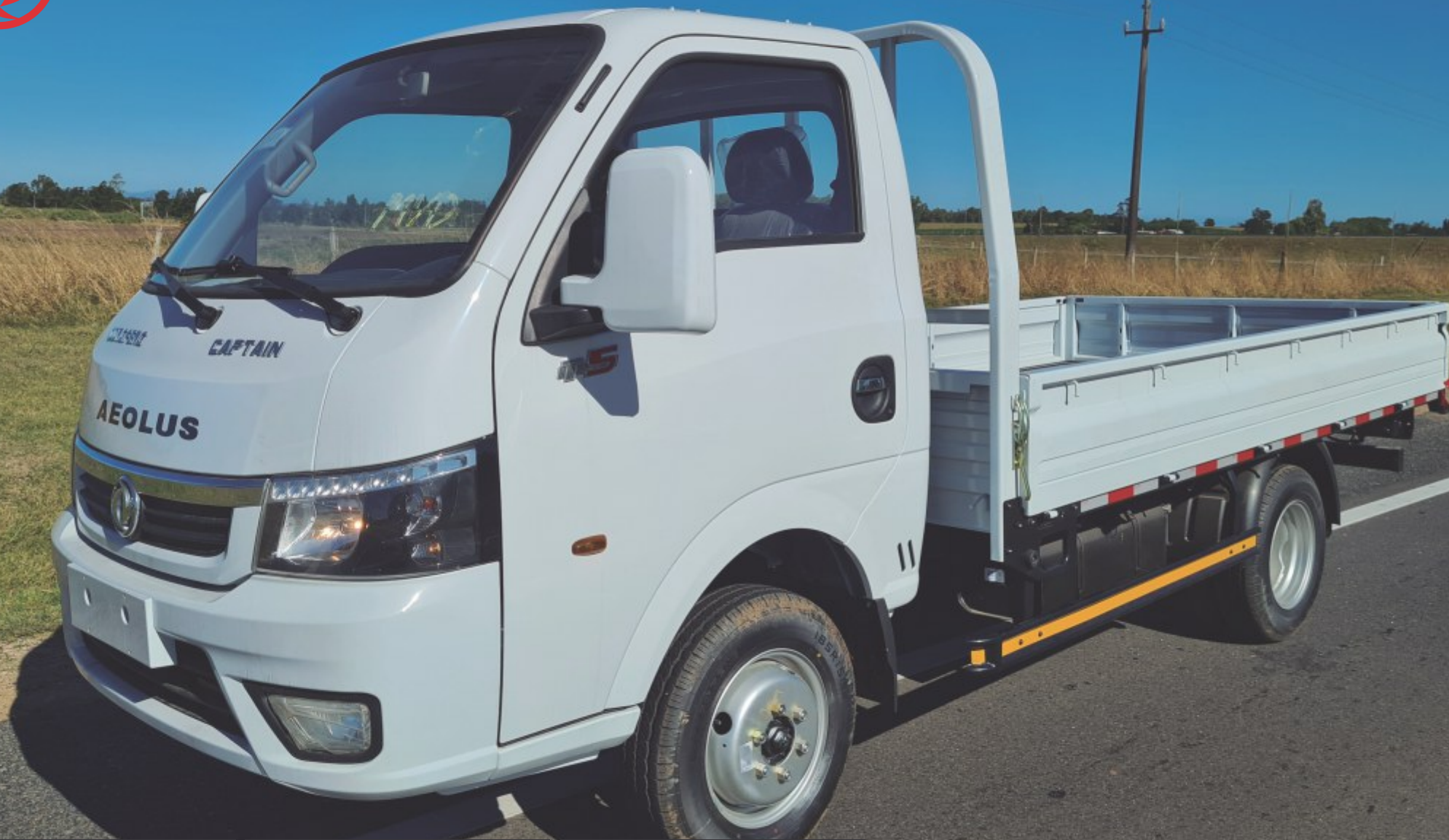
CON O SIN FURGÓN