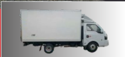
CABINA AMPLIA Y MODERNA